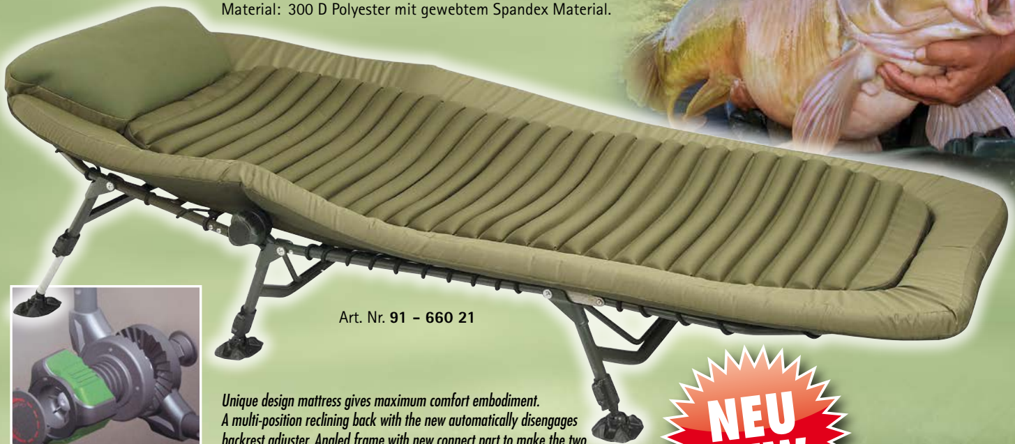
Art. Nr. 91 - 660 21